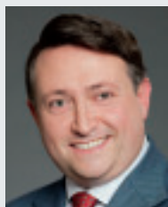
Vincenzo TRANI, Presidente della Camera di Commercio Italo-Russia

In pochi mesi alcune abitudini, anche imprenditoriali, sono drasticamente cambiate e le limitazioni introdotte hanno colpito fortemente la libertà individuale ma anche le opportunità di business. La quasi totalità delle economie e delle industrie mondiali hanno subito un fortissimo contraccolpo.